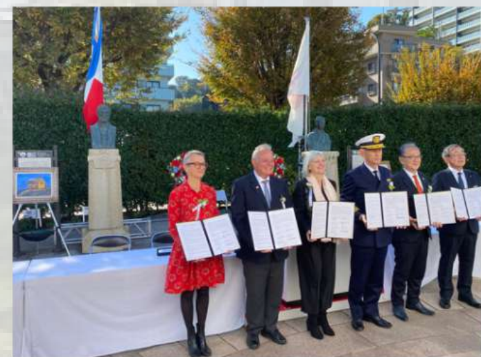
Signature de jumelage, parc Verny-Oguri, Yokosuka, 15 novembre 2025