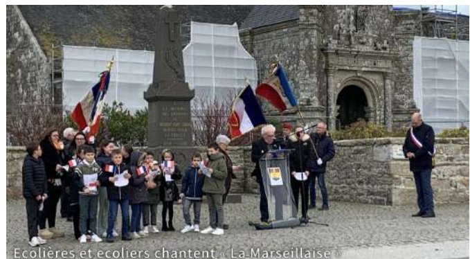
Ecolières et écoliers chantent « La Marseillaise »

A l'issue et à l'invitation du Maire, tous se retrouvèrent au « Mac Laughlin's » pour le verre de l'amitié.