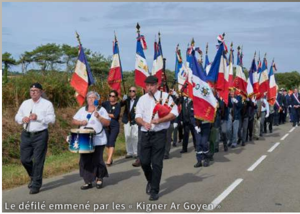
Le défilé emmené par les « Kigner Ar Goyen »

« Au delà de nos peines, il y a la plus grande gloire du monde, celle des hommes qui n'ont pas cédé »