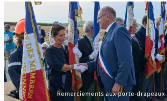
Remerciements aux porte-drapeaux

Après avoir cité la phrase de titre puisée dans les Mémoires de guerre du Général De Gaulle parlant de la Résistance et des résistants, il ajoutera : indéniablement, les hommes qui ont combattu ici à Lesven en font partie. A l'issue des remerciements aux porte-drapeaux par les autorités, le Maire convia l'assemblée au pot de l'amitié à la salle Jean Dorval.